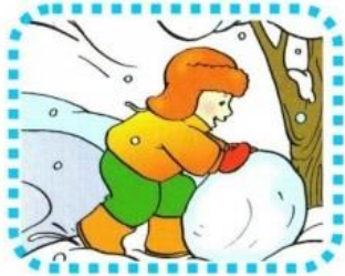
ein großer Schneeball