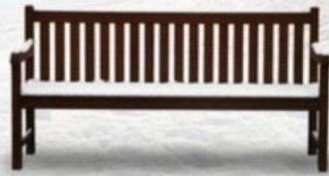
die Bank im Schnee