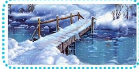
Eis im Wasser