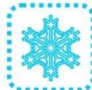
ein großes Schneeflöckchen