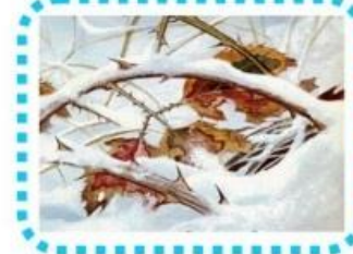
die Blätter unter dem Schnee