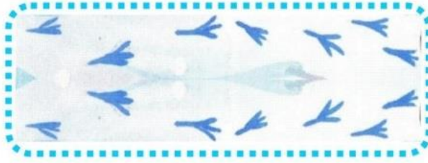
die Vogelspuren auf dem Schnee