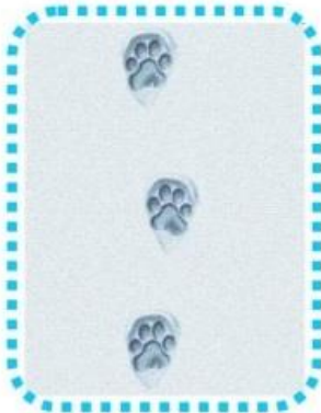
Katzenspuren auf dem Schnee