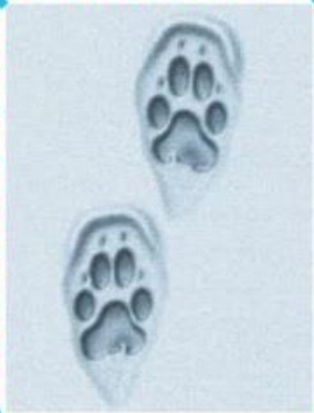
Hundes Spuren auf dem Schnee