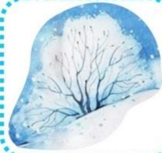
der Busch im Schnee