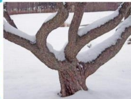
Schnee auf dem Baumstamm