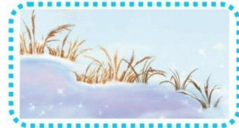
vertrocknetes Gras im Schnee