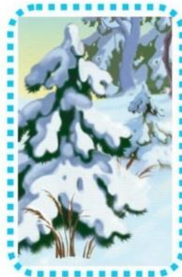
die Tanne im Schnee